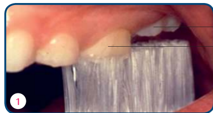
• Eerste blijvende kies • Achterste melkkies

Veel kinderen en ouders merken niet dat de eerste blijvende kiezen doorbreken. Dit gebeurt meestal al voordat de voortanden wisselen. Ze breken achter de laatste melkkies door. Hierdoor liggen ze een beetje verscholen. De verzorging van deze kiezen is erg belangrijk. Het glazuur van de pas doorgebroken kies is nog erg poreus en kwetsbaar. Poets de puntjes van de nieuwe kiezen meteen mee zodra ze zijn doorgekomen. Rond het 12 e jaar breken, achter de eerste blijvende kiezen, opnieuw blijvende kiezen door. Ook die zijn net na het doorbreken extra gevoelig voor het krijgen van gaatjes. De verstandskiezen zijn de laatste kiezen die doorbreken. Sommige mensen krijgen geen verstandskiezen.