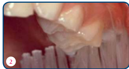
Als je de tanden in de lengterichting poetst, sla je de nieuwe blijvende kies die doorbreekt over (foto 1). Juist de nieuwe kiezen zijn extra kwetsbaar. Zet de tandenborstel daar dwars op de tandenrij (foto 2).

Als nieuwe kiezen doorkomen, zwelt vaak het tandvlees op. Dat is normaal. Het kan pijn doen, maar je hoeft niet ongerust te zijn.