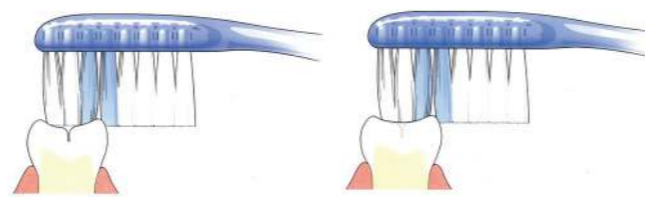
Tandenborstel komt niet in de groef

Kiezen hebben veel groefjes op het kauwvlak. Daarin ontstaat makkelijk tandplak. Niet regelmatig verwijderde tandplak kan gaatjes veroorzaken. Goed poetsen dus! Als de tandarts of mondhygiënist ziet dat er in het kauwvlak een gaatje ontstaat, kan hij besluiten een laagje aan te brengen. Dit heet sealen. Diepe groeven kan hij door het sealen afdichten. Alleen de blijvende kiezen komen normaal gesproken in aanmerking om te sealen. Dit gebeurt meestal kort nadat ze helemaal zijn doorgebroken. Ook gesealde kiezen moet je goed poetsen.