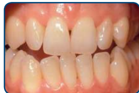
Voor het bleken

De lengte van een bleekbehandeling hangt af van de bleekmethode. Bij de thuisbleekmethode duurt het meestal twee tot drie weken voordat je het gewenste resultaat hebt bereikt. De tandkleur wordt na het beëindigen van de bleekbehandeling altijd weer iets donkerder. Na zes weken kun je pas het echte bleekresultaat zien.