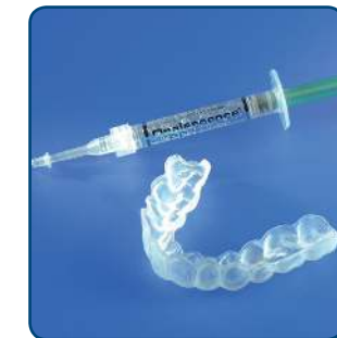
Van de tandarts of mondhygiënist krijg je de doorzichtige bleeklepel en de gel met de blekende werking mee naar huis

Egale, niet te ernstige verkleuringen kun je van buitenaf bleken. Dat gebeurt met behulp van een bleeklepel. Eerst maakt de tandarts of mondhygiënist een afdruk van je gebit. Hiermee maakt de tandtechnicus in het tandtechnisch laboratorium een bleeklepel van een zachte transparante kunststof, die precies over je gebit past en ruimte laat voor de gel. Dat is belangrijk, om irritatie van het tandvlees te voorkomen. De bleeklepel is de mal waarmee je de blekende gel op de tanden aanbrengt. De gel bevat 3 tot maximaal 6% waterstofperoxide. Na een goede instructie hoe je de gel moet aanbrengen en wanneer je de bleeklepel moet dragen, krijg je de bleeklepel en enkele spuitjes bleekgel mee naar huis.