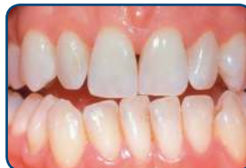
Resultaat na tien dagen bleken met de thuisbleekmethode onder supervisie van de tandarts