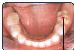
Kaaskies in het melkgebit

Kinderen met kaaskiezen hebben meer gaatjes dan leeftijdsgenoten zonder kaaskiezen. Heeft een kind kaaskiezen in zijn melkgebit? Dan heeft het een grotere kans op de ontwikkeling van kaaskiezen in zijn blijvend gebit. In Nederland heeft 5-9% van de kinderen kaaskiezen in het melkgebit. In het blijvend gebit heeft 9-14% van de kinderen één of meerdere kaaskiezen. Kinderen met kaaskiezen in het blijvend gebit, hebben ook kans op een wit-gele verkleuring van de blijvende voortanden.