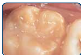
Kaaskies in het blijvend gebit