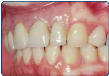
Plaatprothese van opzij