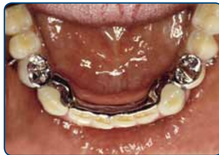
Frameprothese met verankering op kronen