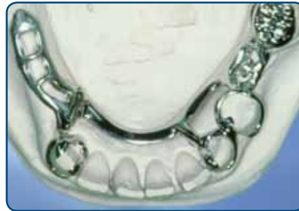
Frameprothese in wording op een gipsmodel, zonder kunsttanden en -kiezen

Bij een slotje wordt de ene kant vastgemaakt aan een kroon, tand of kies en de andere kant zit vast aan de frameprothese. De frameprothese kunt u op die manier in het slotje schuiven. Het slotje zit doorgaans aan de binnenkant van de tanden en kiezen en is dus niet vanaf de buitenkant zichtbaar. Ankertjes zijn vaak wel enigszins zichtbaar.