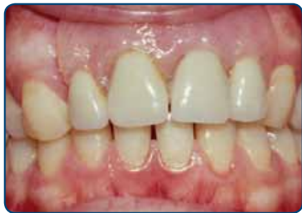
Plaatprothese van voren

De plaatprothese is gemaakt van een roze, tandvleeskleurige kunsthars. Daarin zijn de kunsttanden en -kiezen verankerd. De gehele plaatprothese rust op het slijmvlies van de mond. Deze zit eventueel met ankertjes vast aan overgebleven tanden of kiezen.