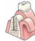
Er wordt een gaatje in het bot geboord