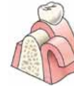
Het tandvlees wordt losgemaakt