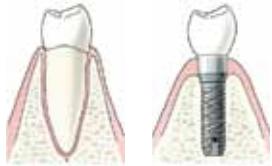
Een wortel met kies

Een implantaat kunt u het beste vergelijken met een kunstwortel. Een implantaat vervangt een afwezige tandwortel en wordt als een schroef in de kaak gebracht. Implantaten worden gemaakt van een lichaamsvriendelijk materiaal zoals titanium.