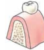
Plaats waar het implantaat komt

De tandarts of kaakchirurg brengt de implantaten in. Eerst krijgt u een plaatselijke verdoving. Daarna wordt het tandvlees op de plek waar het implantaat moet komen losgemaakt, zodat het kaakbot zichtbaar wordt. Dan wordt een gaatje in het kaakbot geboord. Daarin wordt het implantaat geschroefd of getikt. Het tandvlees wordt vervolgens gehecht. Als u meer dan één implantaat nodig heeft, worden deze vrijwel altijd tijdens dezelfde behandeling ingebracht.