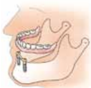
Twee met elkaar verbonden implantaten dienen als verankering voor de overkappingsprothese

Dan kan op implantaten (meestal twee) een overkappingsprothese worden geplaatst. Deze wordt op de implantaten vastgeklemt.