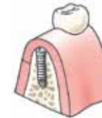
Het tandvlees wordt gehecht