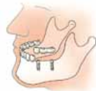
Drie kiezen zijn vervangen door twee implantaten voorzien van een brug

De implantaten worden in deze situatie van een vastzittende brug voorzien. Een brug is een voor de patiënt niet uitneembare vervanging van één of meer ontbrekende tanden en/of kiezen.