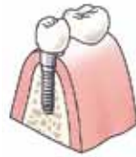
De kroon is op het implantaat geplaatst