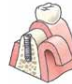
Het implantaat wordt aangebracht